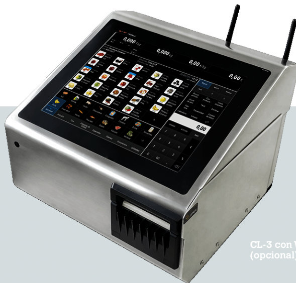
CL-3 con Wi-Fi (opcional)