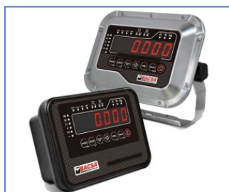
Indicador Solo Peso