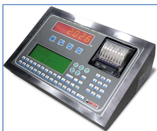
Terminal alfanumérico con impresora