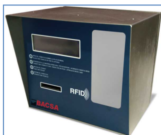
Lector exterior autoservicio para efectuar pesadas de forma autónoma sin pesador.