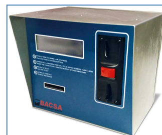
Monedero exterior para el cobro automático de pesadas.