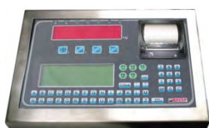
Terminal alfanumérico con impresora