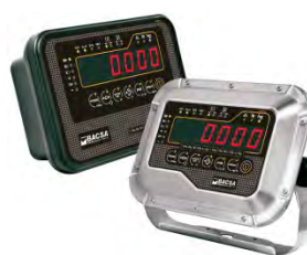
Indicador Solo Peso